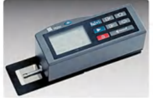
粗糙度仪 Roughness tester