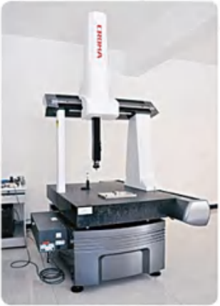
三坐标测量仪 coordinate measuring instrument