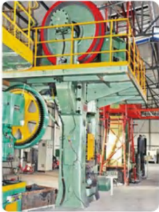
630 双盘摩擦压力机 630 double disc friction press