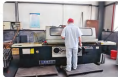
外圆磨床 Cylindrical grinder