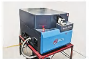
纳克光谱分析仪 Full hydraulic die forging hammer