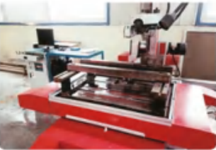
线切割机 Wire cutting machine