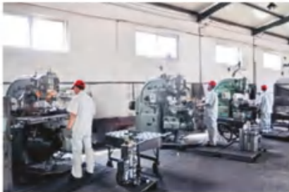
数控铣床车间 CNC milling machine workshop