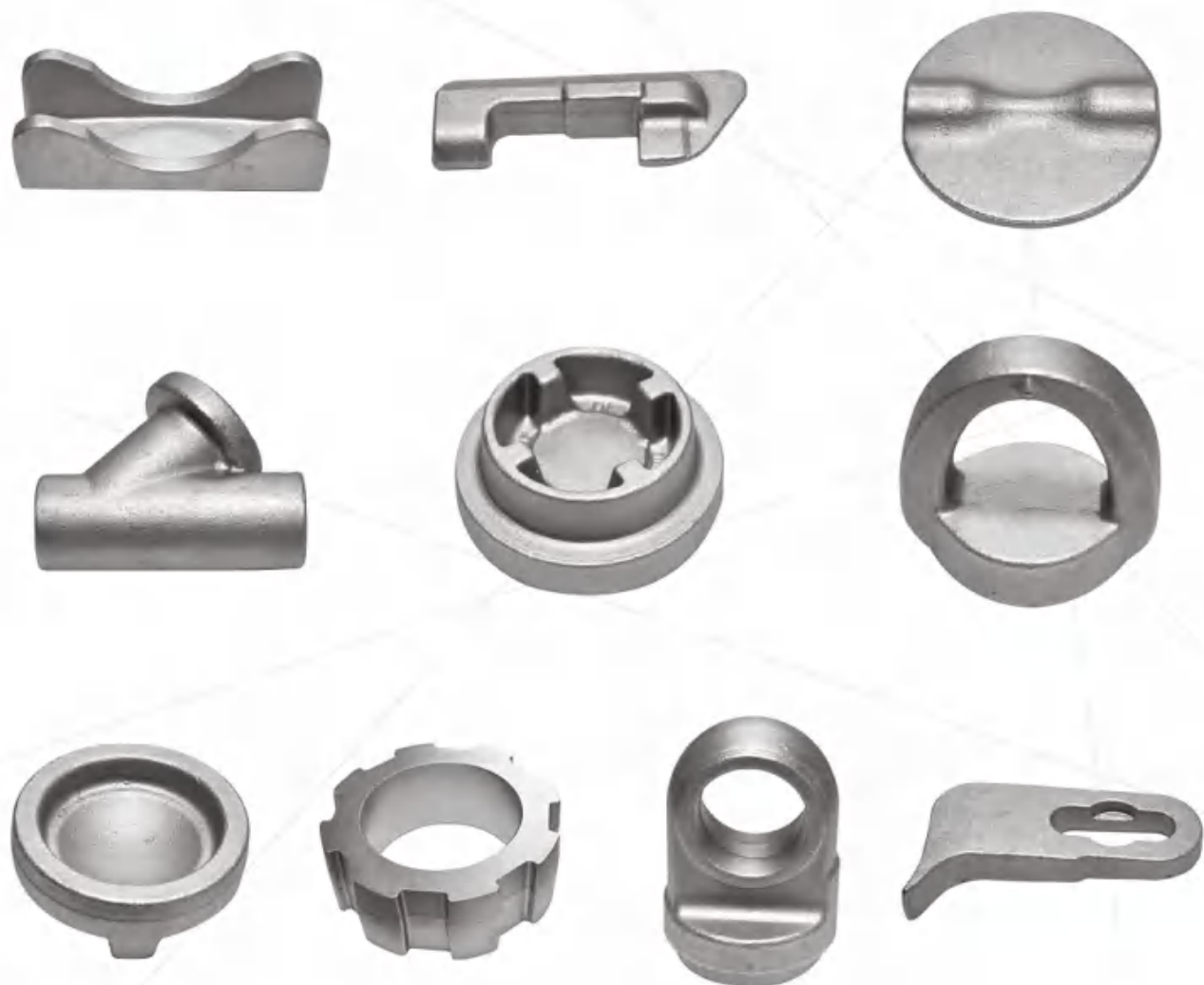
其他部件 Other parts