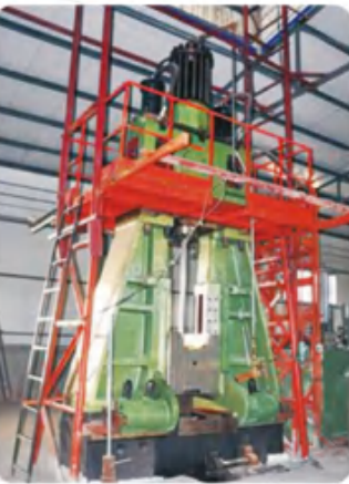
全液压模锻锤 Full hydraulic die forging hammer