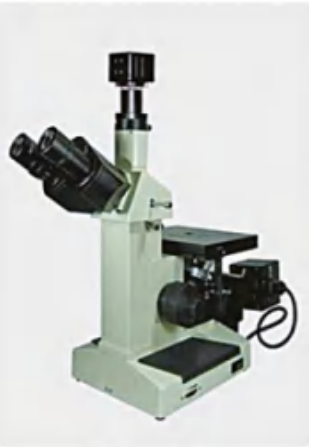
金相分析仪 Metallographic analyzer