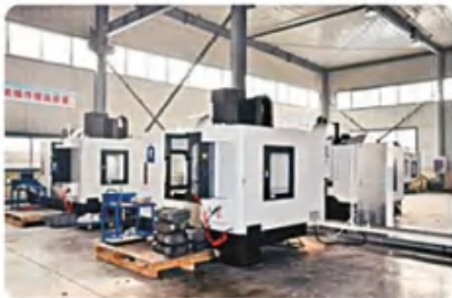
加工中心组 2 Machining center group 2