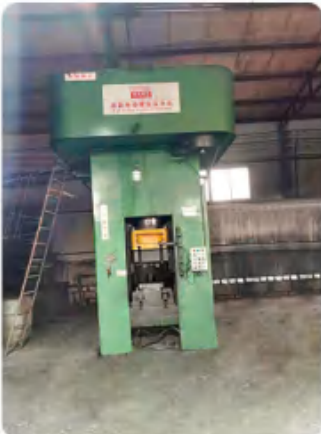
400 离合器式高能电动螺旋压力机 400 clutch type high energy electric screw press