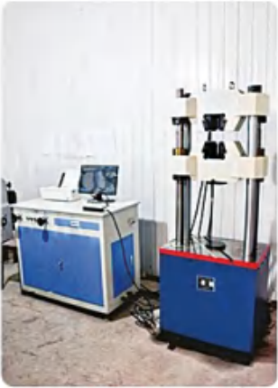
万能试验机 Universal testing machine