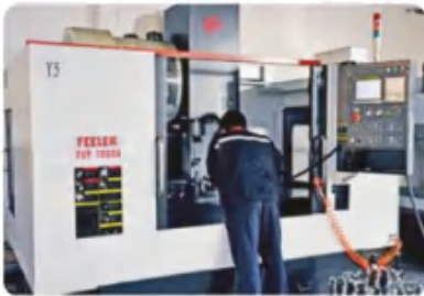
加工中心 Machining center