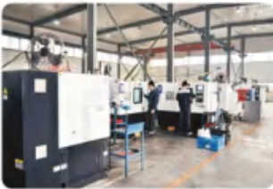
数控车床 CNC lathe