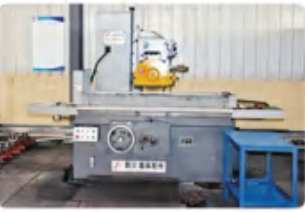
平磨机 Flat mill