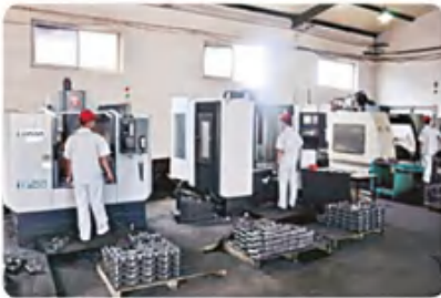
加工中心车间 Machining center workshop