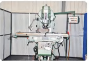
立式铣床 Vertical milling machine