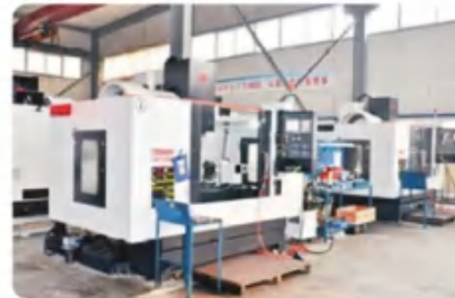
四轴加工中心 Four axis machining center