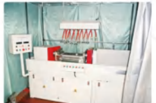
磁粉探伤仪 Magnetic particle flaw detector