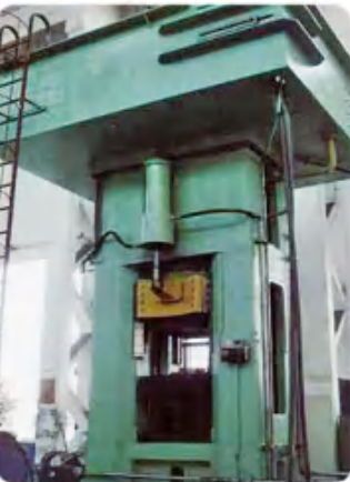
1000 电动螺旋压力机 1000 electric screw press