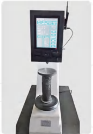
布氏硬度计 Brinell hardness tester