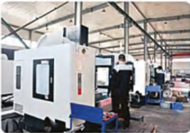
加工中心车间 Machining center workshop