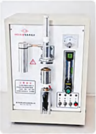
电弧燃烧炉 Electric arc furnace