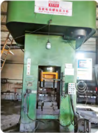
630 电动螺旋压力机 630 electric screw press