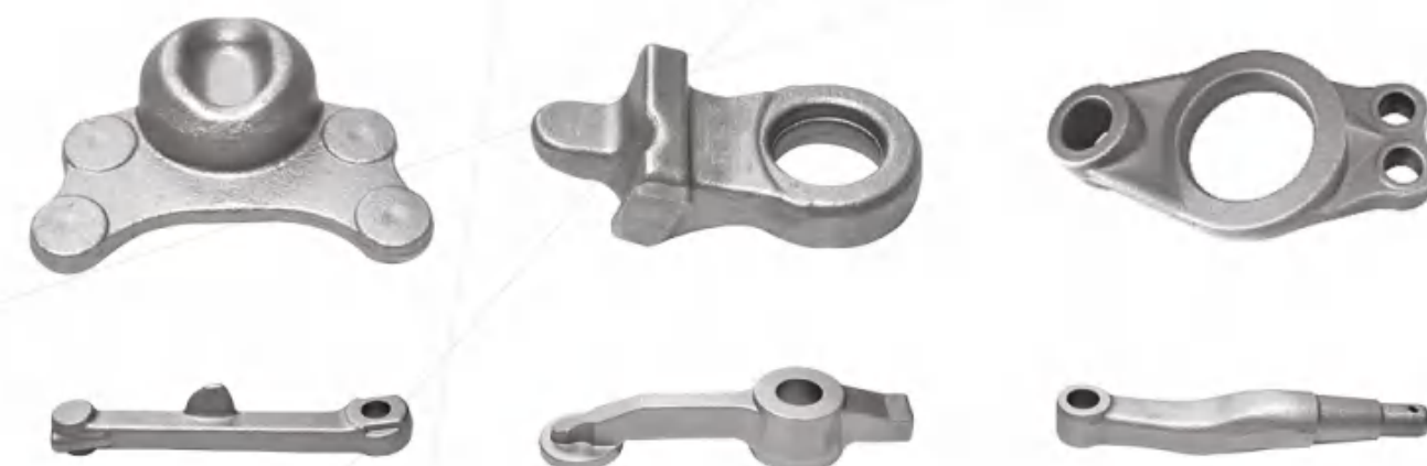
电梯配件 Elevator accessories