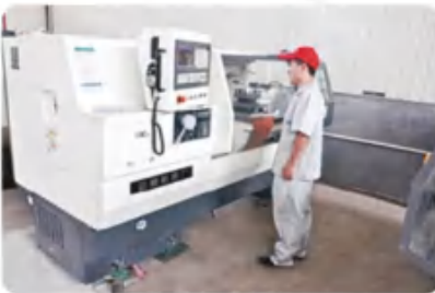
数控车床 CNC lathe