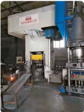
1600 离合器式高能电动螺旋压力机 1600 clutch type high energy electric screw press