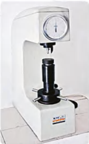
洛氏硬度计 Rockwell hardness tester