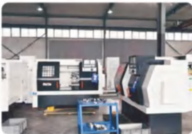
数控车床 CNC lathe