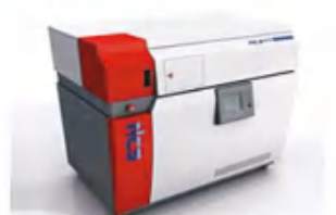
纳克光谱分析仪 Full hydraulic die forging hammer