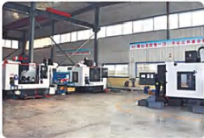
加工中心组 1 Machining center group 1